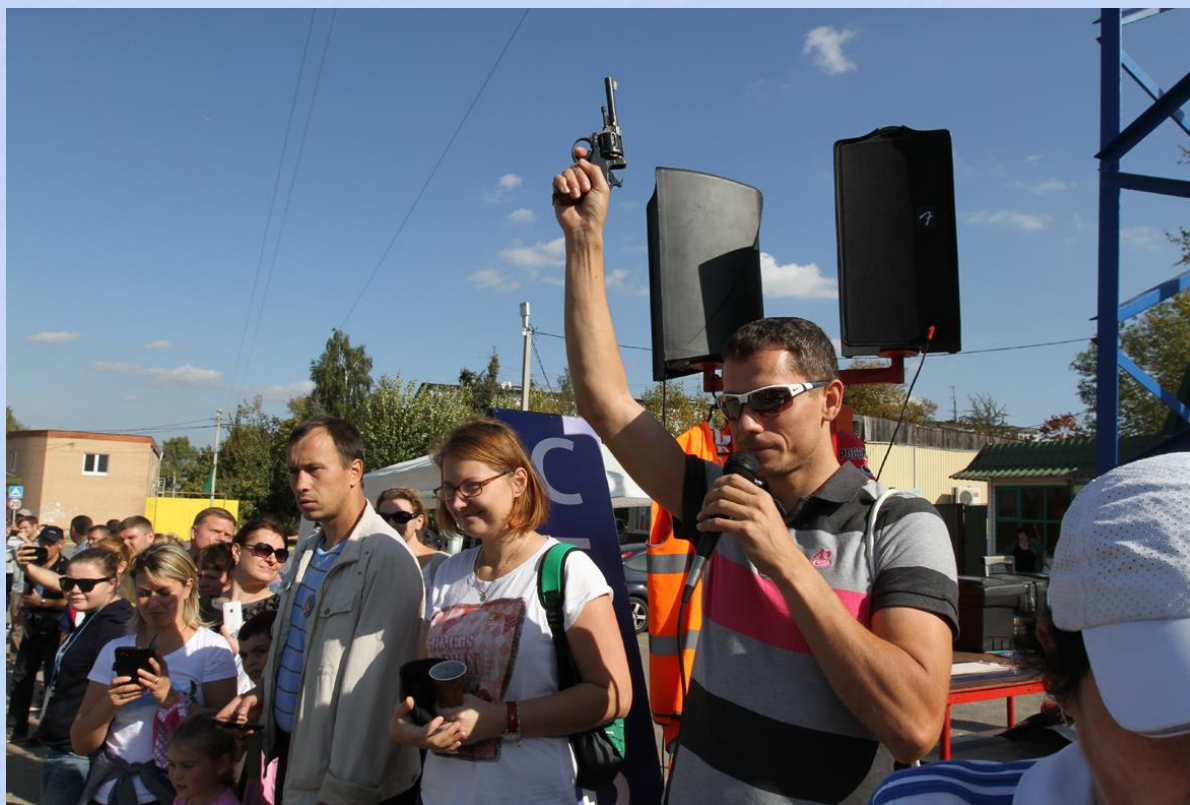
Олимпийский чемпион Ю.Борзаковский дает старт.